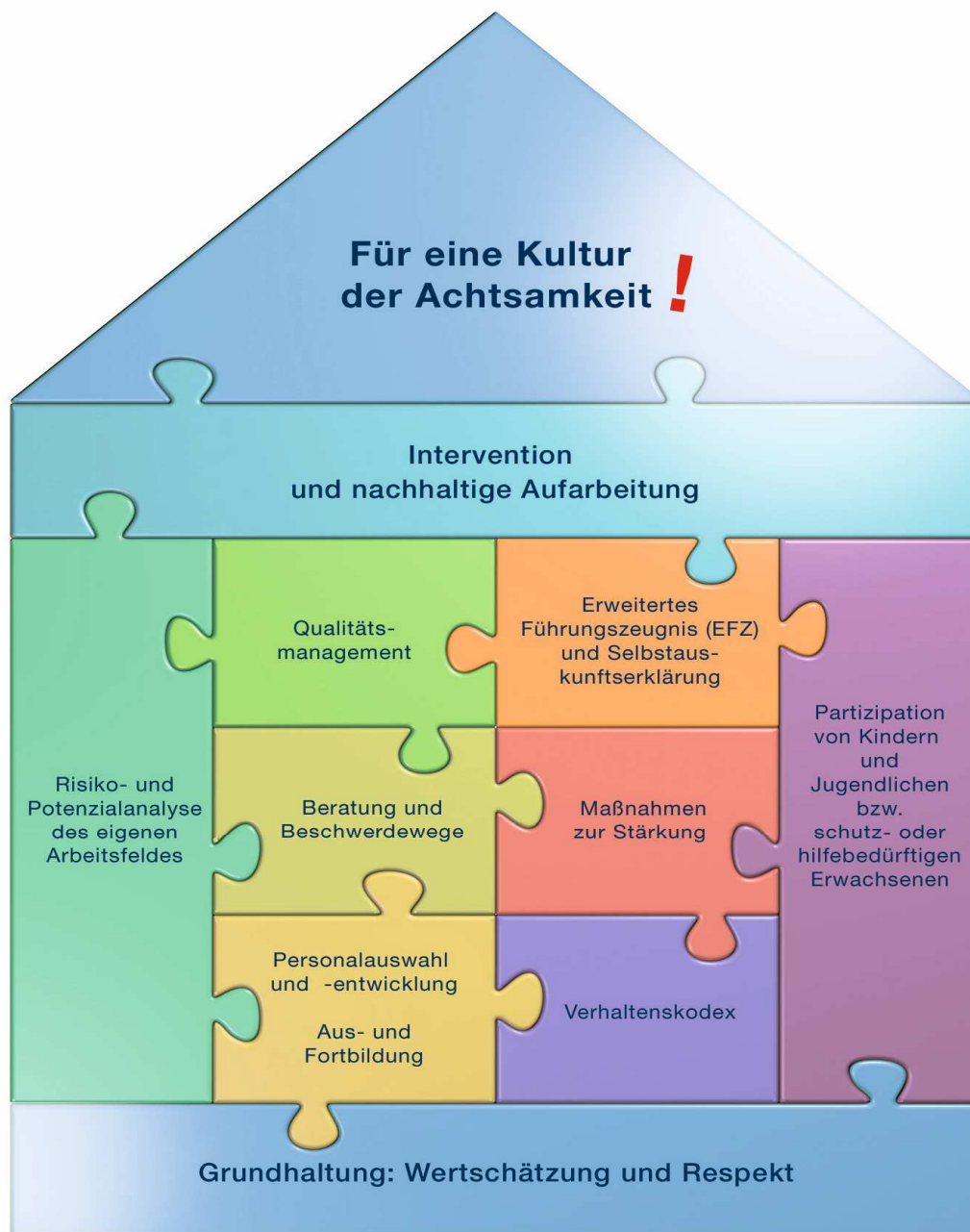
Schaubild Institutionelles Schutzkonzept